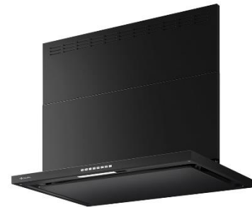
テクスチャーブラック