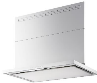
テクスチャーホワイト