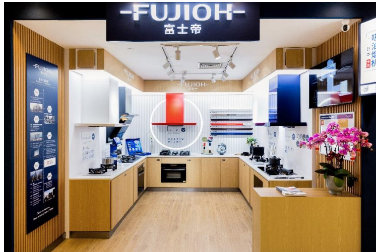
富士帝 APiTA 店

今回自社運営の店舗を中国に初めてオープンすることで、お客様に対して日本の技術や品質をアピールし、FUJIOH ブランドの更なる認知度向上を目指します。富士帝 APiTA 店では、中国市場向けの代表的な製品を展示しているほか、特許技術 ※4 であるオイルスマッシャー技術のデモ体験やお手入れを簡単にする親水系コート ※4 の体験が可能です。店内は FUJIOH のブランドカラーである藍色と木目調を基調とした、日本のブランドらしい明るく温かみのあるデザインです。